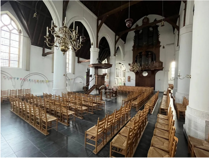
Afbeelding 1: Kerkzaal Oude Kerk